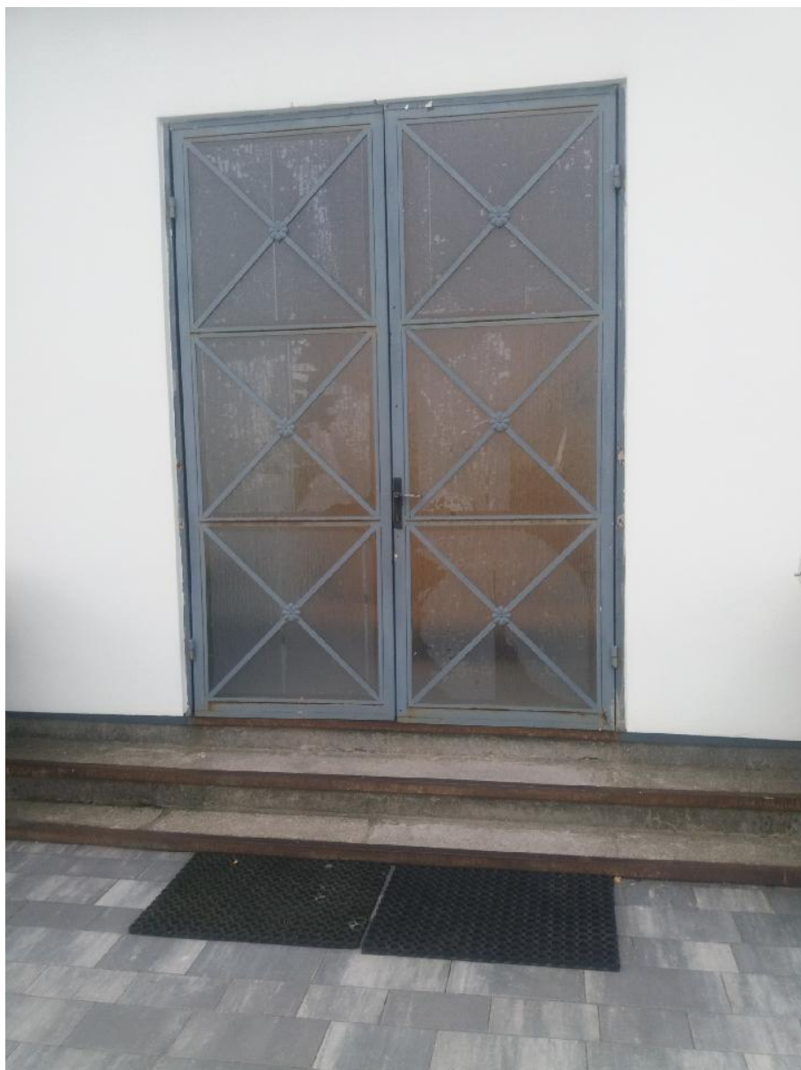
Zdj. Nr 5 – Istniejące schody do remontu od strony wejścia głównego do kościoła