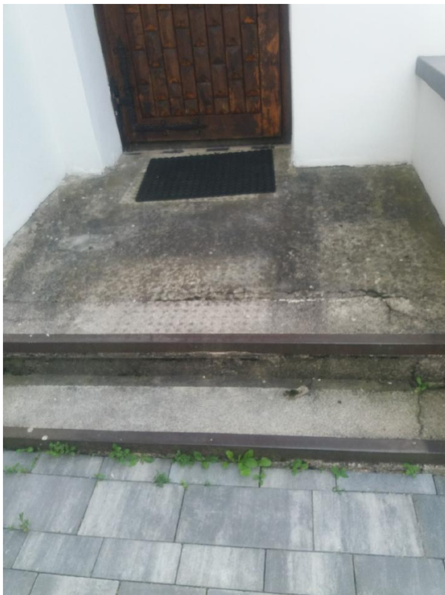
Zdj. Nr 6 - Istniejąca schody przy drzwiach dębowych