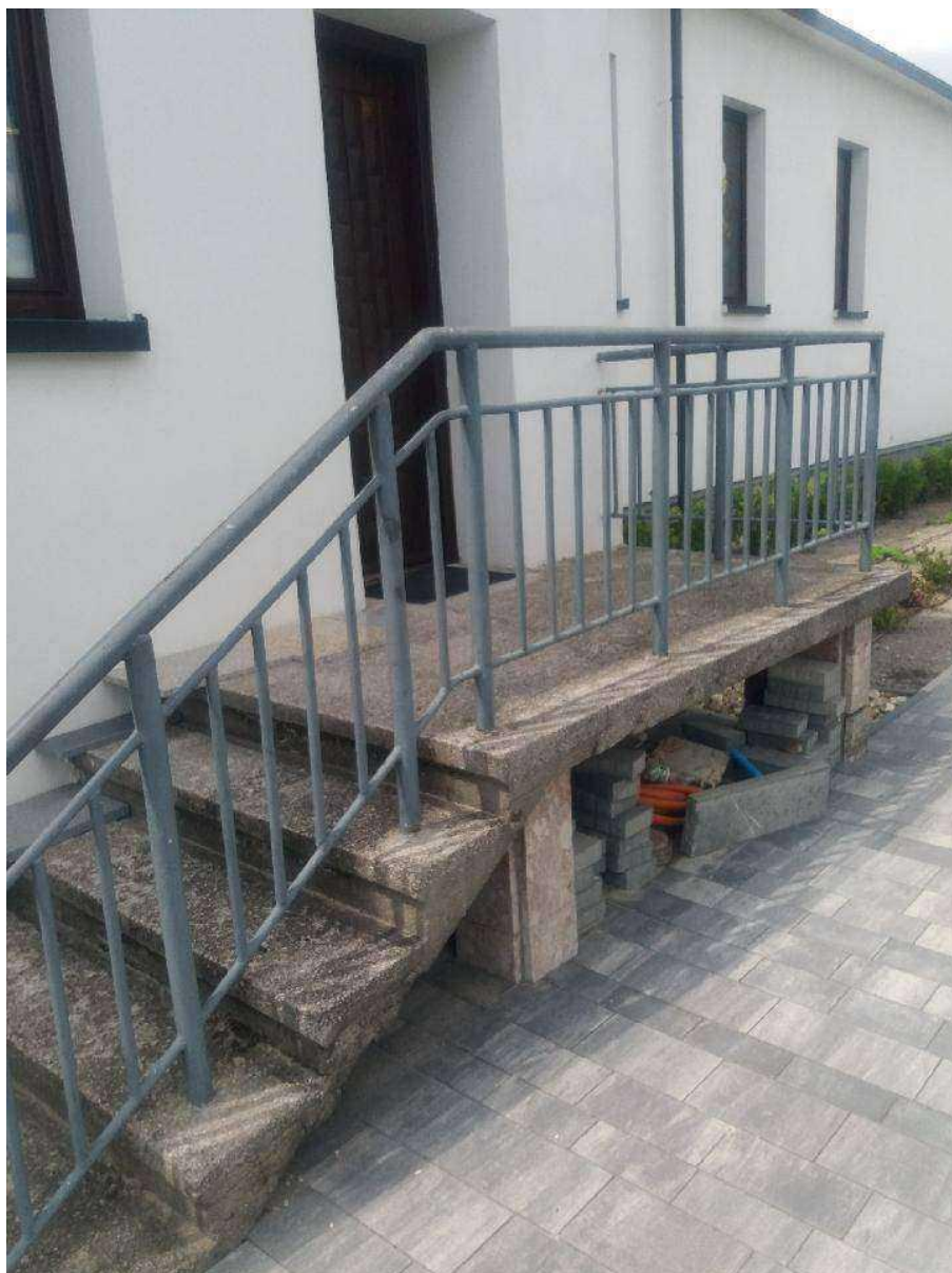
Zdj. Nr 7- Istniejąca schody do remontu od strony wschodniej.