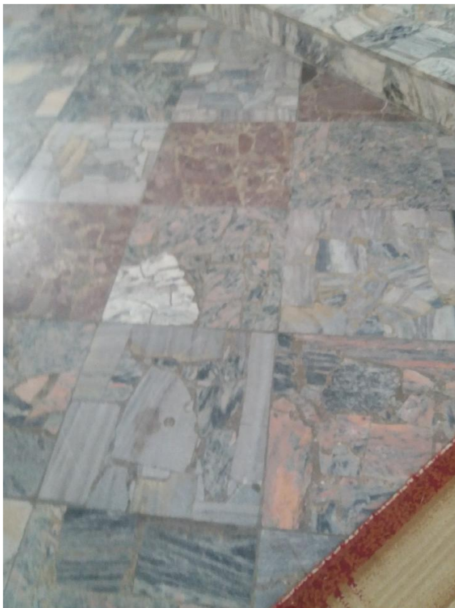
Zdj. Nr 2 - Istniejąca posadzka do renowacji