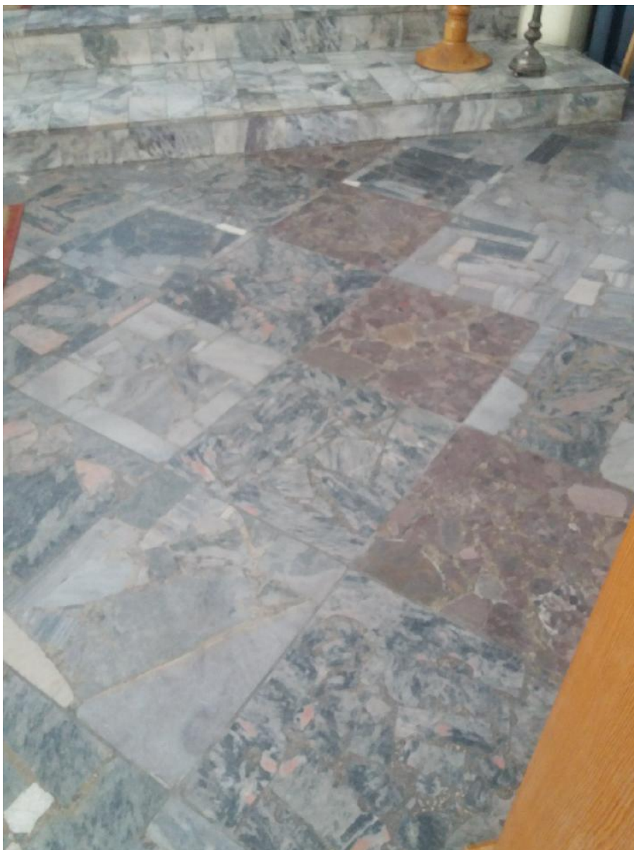
Zdj. Nr 1 - Istniejąca posadzka do renowacji