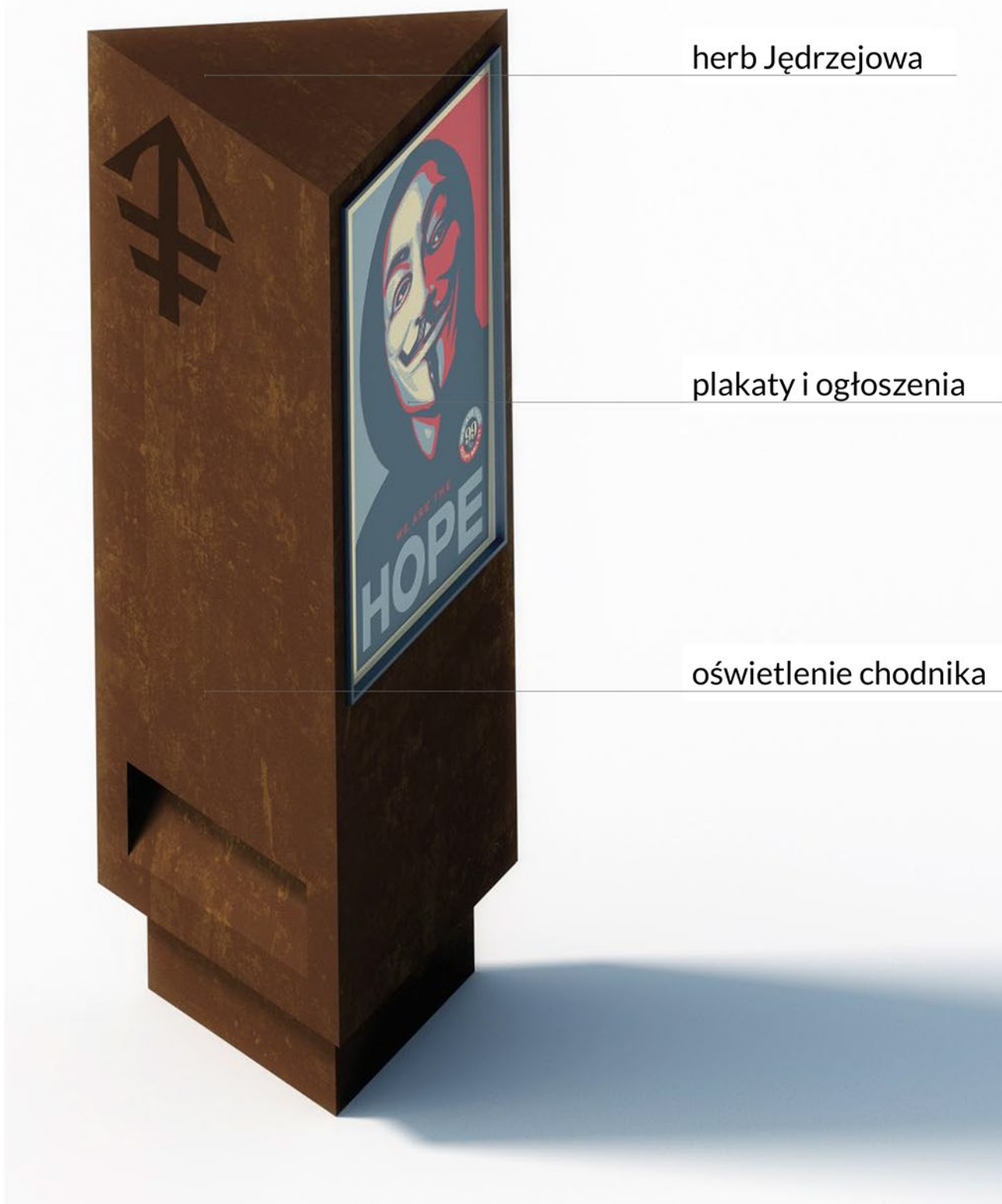
INFO-BOX - słup ogłoszeniowy