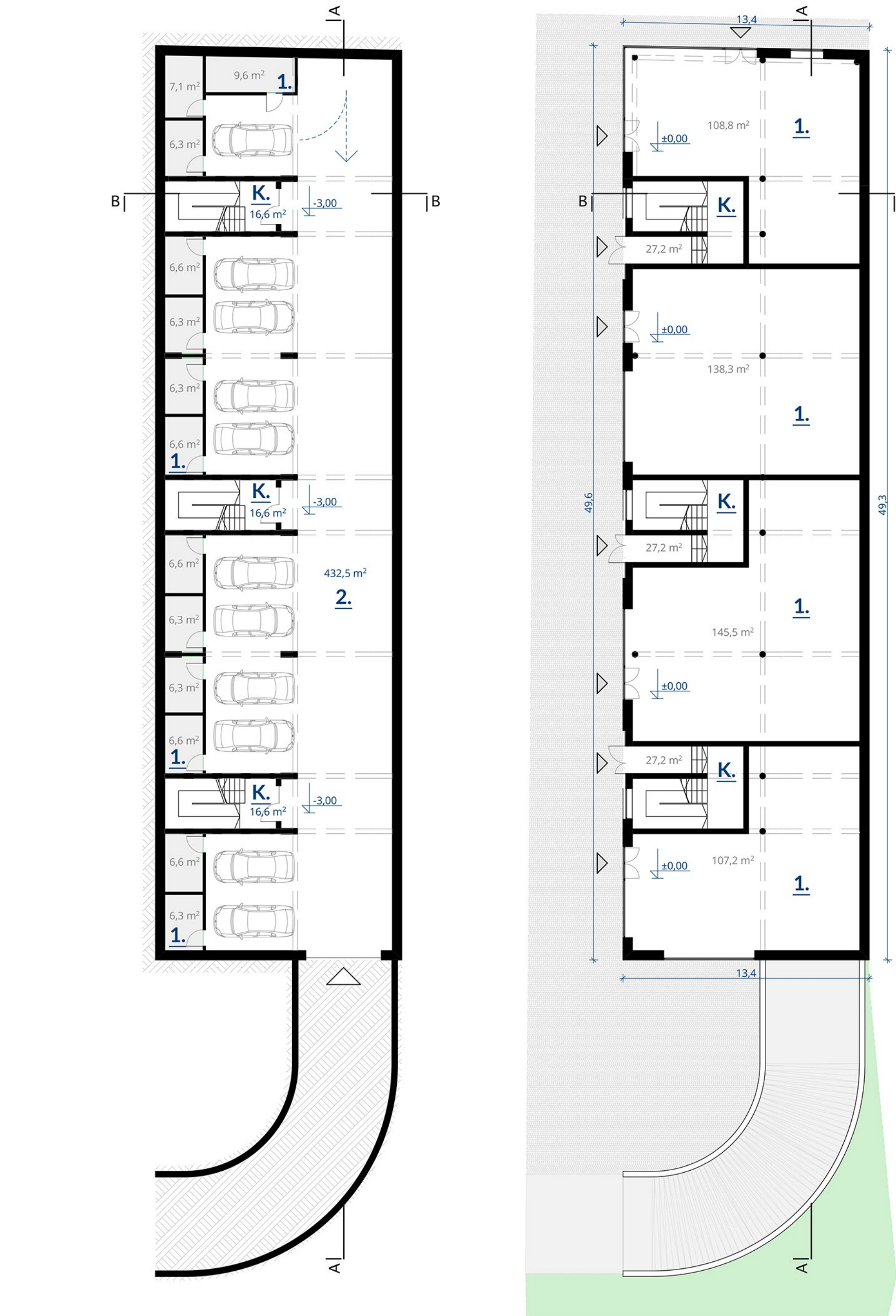
RZUT POZIOMU -1 parking podziemny