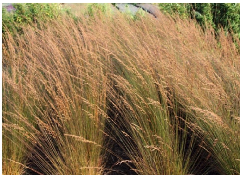
trzęślica (Molinia Schrank)