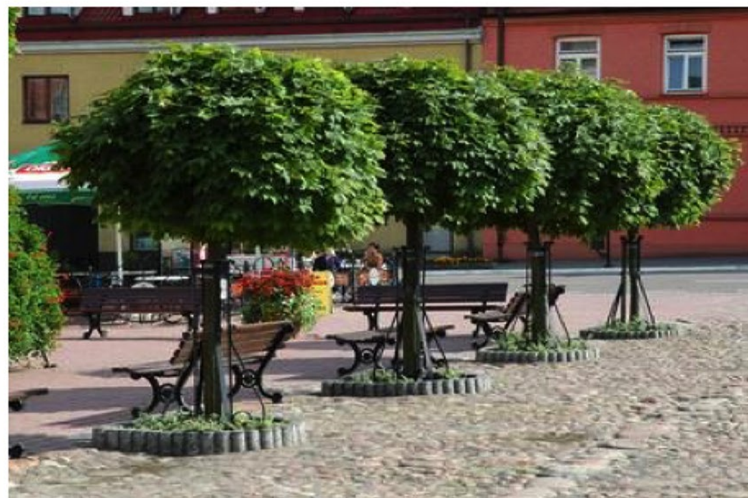
Klon pospolity 'Globosum' (Acer platanoides 'Globosum')