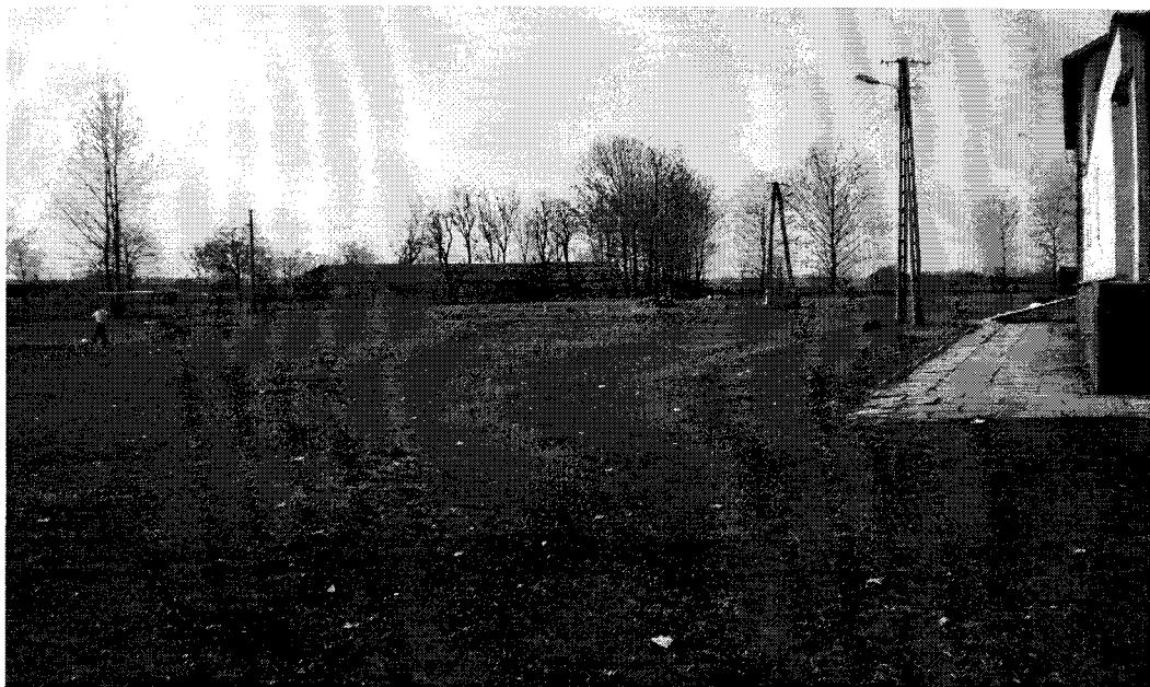
Zdjęcie 1. Boisko sportowe na terenie Szkoły Podstawowej w Mnichowie.