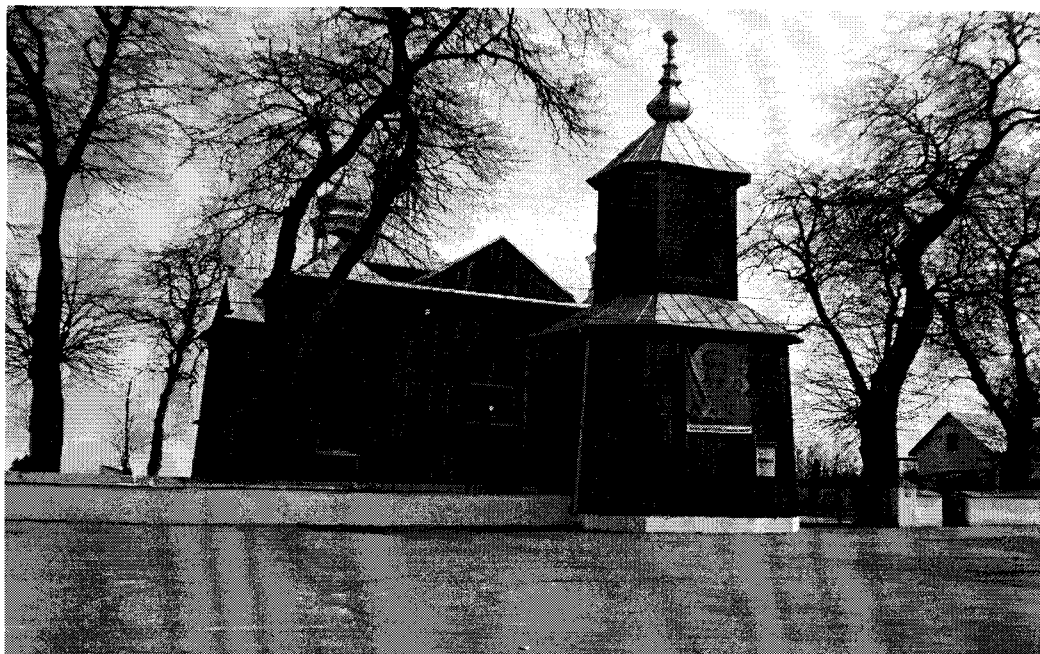
Zdjęcie 3. Zabytkowy Kościół Św. Szczepana w Mníchowie.