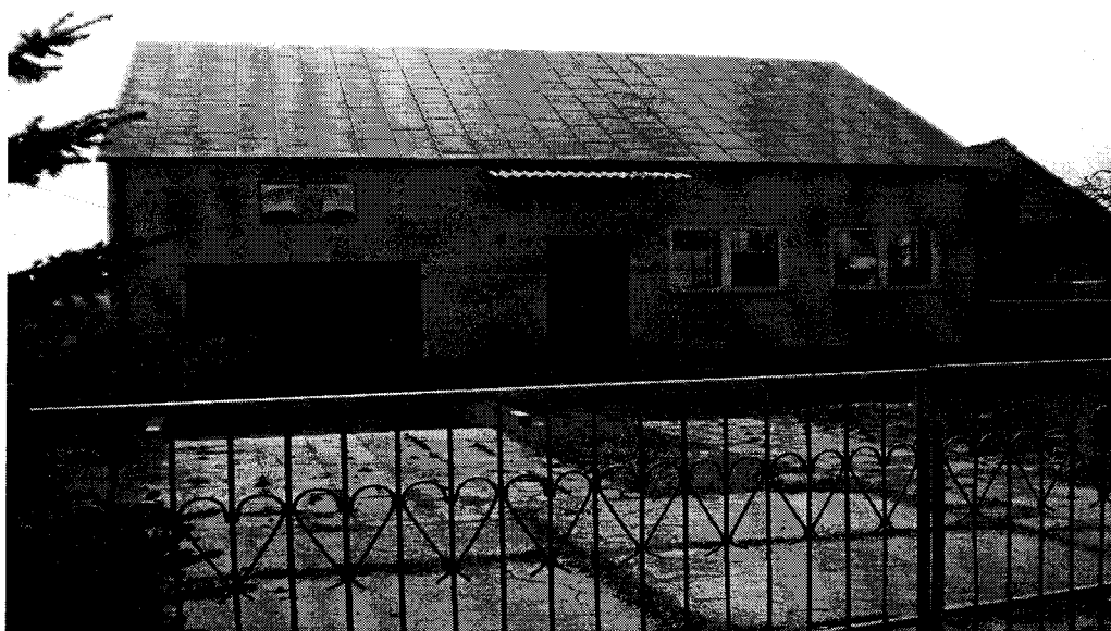
Zdjęcie 2. Budynek Remizy OSP w Mnichowie.